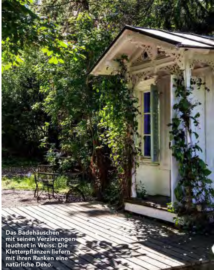
Das Badehäuschen mit seinen Verzierungen leuchtet in Weiss. Die Kletterpflanzen liefern mit ihren Ranken eine natürliche Deko.

Alle Pflanzen im Weiertal wurden bewusst angesiedelt. Den einen behagten die Standorte besser als den anderen, und sie wachsen entsprechend üppiger. Die von Meiss