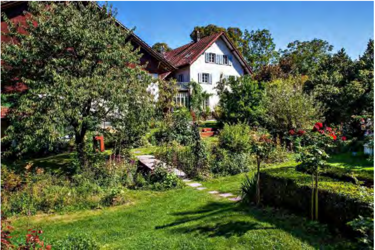
Das alte bäuerliche Anwesen mit Wohnhaus und Scheune ist umgeben von einem wohnlichen Garten.

Wo heute die grossen Bäume stehen, gabs einst nur Wiesen