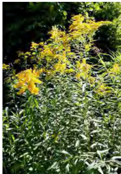
Goldgelb leuchten die Goldruten in der Spätsommersonne.

seine Frau nicht, aber ein natürliches Paradies, ein Stück ungekünstelte Natur, in der man sich wohlfühlen kann. Auch die weitere Umgebung des Grundstücks stimmt: Am Steilhang hinter dem Haus ist ein Weinberg angelegt worden, und auf die andere Seite geniesst man einen herrlichen Weitblick über die Ebene