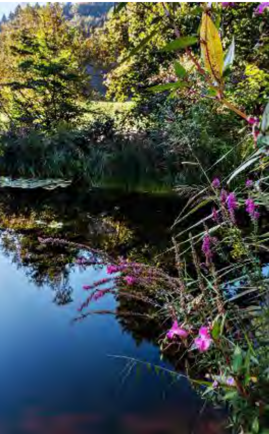
Silbern spiegelt sich der Himmel im Wasser, Bäume und Uferpflanzen leuchten auf im Gegenlicht.

Fauna und Flora im und ums Wasser beobachten kann: Libellenlarven, Molche, Käfer, Seerosen. Sumpfpflanzen umgeben den Teich, ein Schilfgürtel steht am andern Ufer. Jenseits des Teichs unter den Bäumen steht auch ein Badehäuschen, liebevoll Datscha genannt. Es ist hell gestrichen und reich verziert und stand einst bei der ehemaligen Neumühle in Töss. «Mit den Seerosen im Vordergrund erinnert es uns an Werke von Monet», meint der Hausherr. Der kleine Pavillon dient auch als Kulisse für musikalische Aufführungen, Lesungen und Aperitifs. Und dass er sich gut in die Kunstausstellungen integrieren lässt, hat im vergangenen Jahr der italienische Künstler Maurizio Nannucci mit einer Lichtinstallation gezeigt.