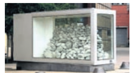
Der Kunstkasten.